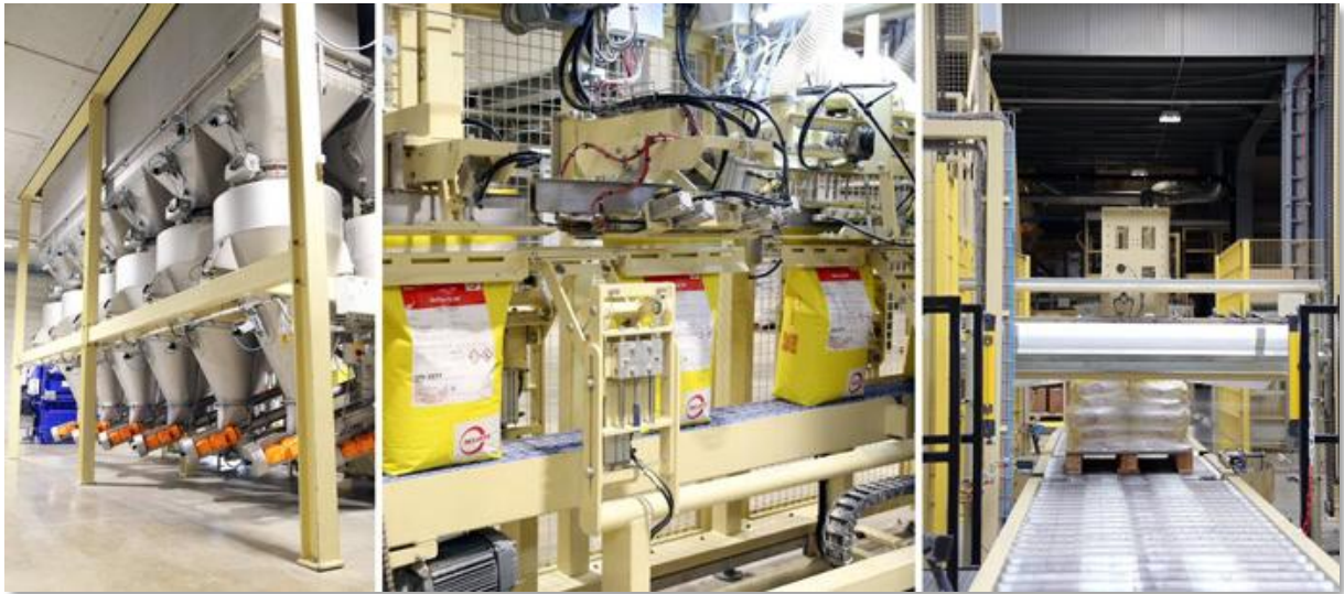
MIAVIT Produktionsanlage 1